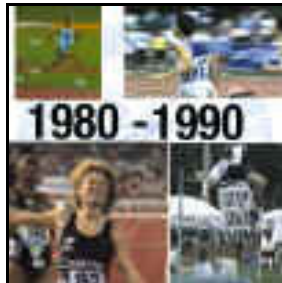
DVD 4 : 1980-1990