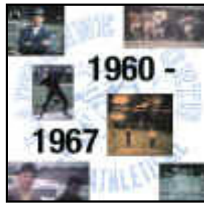
DVD 2 : 1960-1967