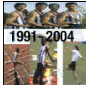
DVD 5 : 1991-2004