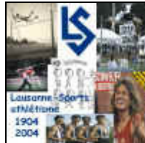
DVD 6 : 1904-2004

L'intégrale des 6 DVD coûte Fr. 30.00, mais il est possible de les acquérir individuellement au prix imbattable de Fr. 5.00. Ils peuvent être commandés en envoyant un e-mail au webmaster (pabettex@citycable.ch) ou en s'inscrivant sur la liste qui est affichée sur les panneaux des vestiaires à la Pontaise. Il vous reste également la possibilité de consulter la rubrique "Histoire du club" sur notre site Internet. La saga du LS athlétisme y est retracée dans son intégralité et elle permet de découvrir en détail la carrière d'une septantaine de nos têtes d'affiche qui ont brillé durant un siècle.