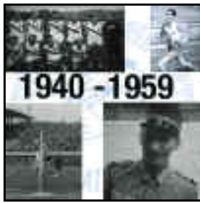
DVD 1 : 1940-1959