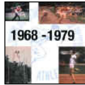
DVD 3 : 1968-1979